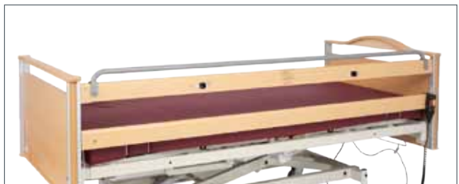
Grindforhøyer "Bue" monteres på øvre grindbom