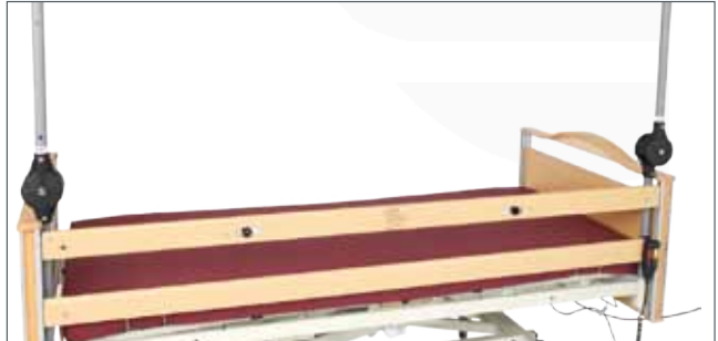
Grindforhøyer "Smart" er enkel å montere