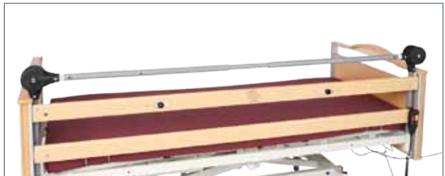
Grindforhøyer "Smart" sammenkoblet