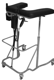
Gåbord OS-1590 EL