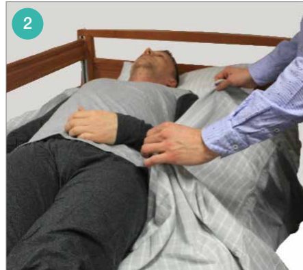
Pak dicht bij de cliënt, ter hoogte van de heup en de schouder, de stof van het steeklaken op.