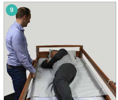
Leg het laken netjes en doe de beddekken omhoog.

Deze techniek kaart geeft een indicatie van de mogelijkheden. Direct Healthcare Group kan niet aansprakelijk gehouden worden voor de gevolgen van uitgevoerde transfers. Raadpleeg altijd de handleiding van de gebruikte producten en voer altijd vooraf een risico inventarisatie uit.