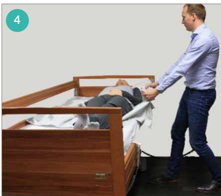
Ga in schredestand staan en houd beide armen gestrekt. Leun achterover en gebruik je lichaamsgewicht om de cliënt naar de rand van het bed te verplaatsen.