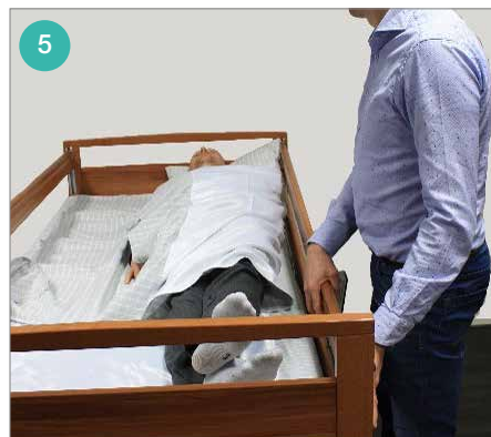
Leg het laken over de cliënt, doe het beddek omhoog en loop naar de andere kant van het bed.