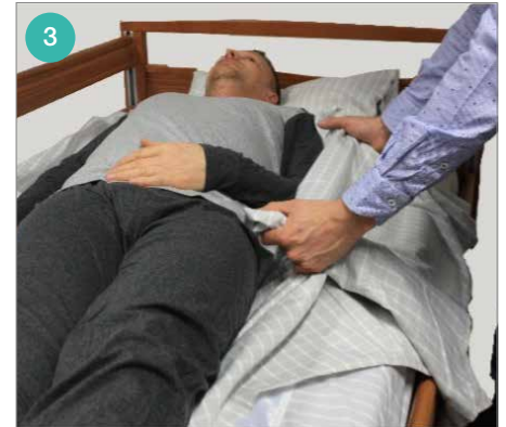
Pak in beide handen een grote prop stof. De duimen van je vuisten zijn omhoog gericht.