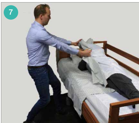
Pak het laken dicht bij de cliënt ter hoogte van de heup en de schouder op en maak grote proppen stof. Gebruik je lichaamsgewicht om de cliënt om te rollen.