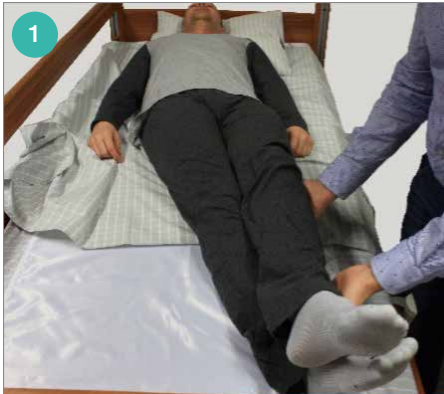
Verplaats de benen richting de rand van het bed en plaats het dichtstbijzijnde been over het andere been.