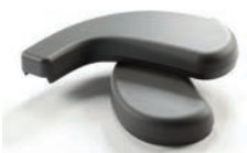
Armstödsdynor/ underbensstöd PU