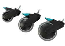
Hjul med broms 75, 100, 125mm