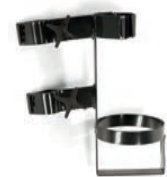
Tubhållare inkl. fäste