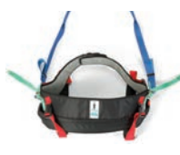
Gåtränings Kit Multi Med Gåträningskit MULTI så gör du din uppresnings- sele till en gåträningssele