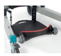
Hälband till ståplatta