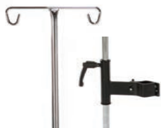
Droppstång inkl. fäste