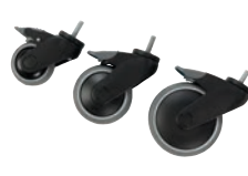
Hjul med riktningsspär 75, 100, 125mm