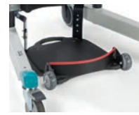
Hälband till ståplatta