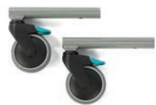
Tippskydd - bakåt