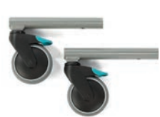
Tippskydd - bakåt