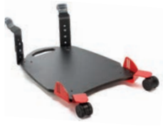
Ståplatta kort/lång, länkhjul (SW)