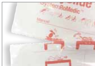
Perorerad i 50 cm bitar; lätt att dra ut och riva av rätt längd.