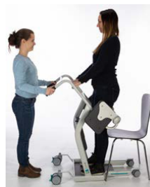
4. Placera Mover så att vårdtagaren enkelt kan placera sina fötter på fotplattan och knä/underben mot underbenstödet. Låt vårdtagaren greppa i den tvärgående stängningen och sedan resa sig upp.