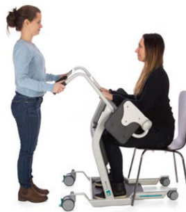
2. Kör intill vårdtagaren.