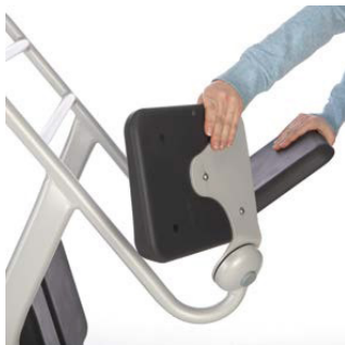
1. Fäll upp de två säteshalvorna.