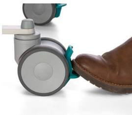
3. Lås bromsen