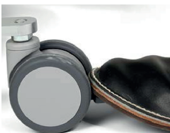
3. Lås bromsen