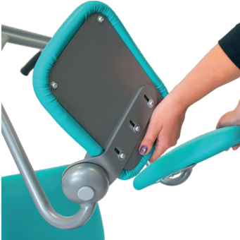
1. Fäll upp de två säteshalvorna.