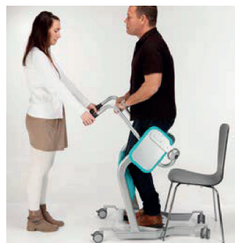
4. Placera Mover Plus så att vårdtagaren enkelt kan placera sina fötter på fotplattan och knä/underben mot knäskyddet. Låt vårdtagaren greppa i den tvärgående stängeln eller handtagen och sedan resa sig upp.