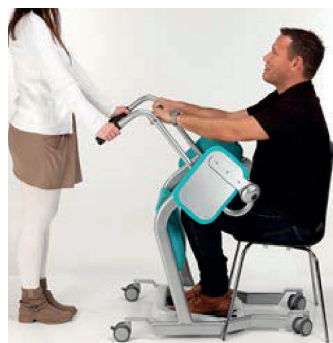
2. Kör intill vårdtagaren.