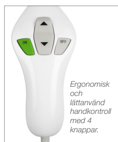
Ergonomisk och lättanvänd handkontroll med 4 knappar.