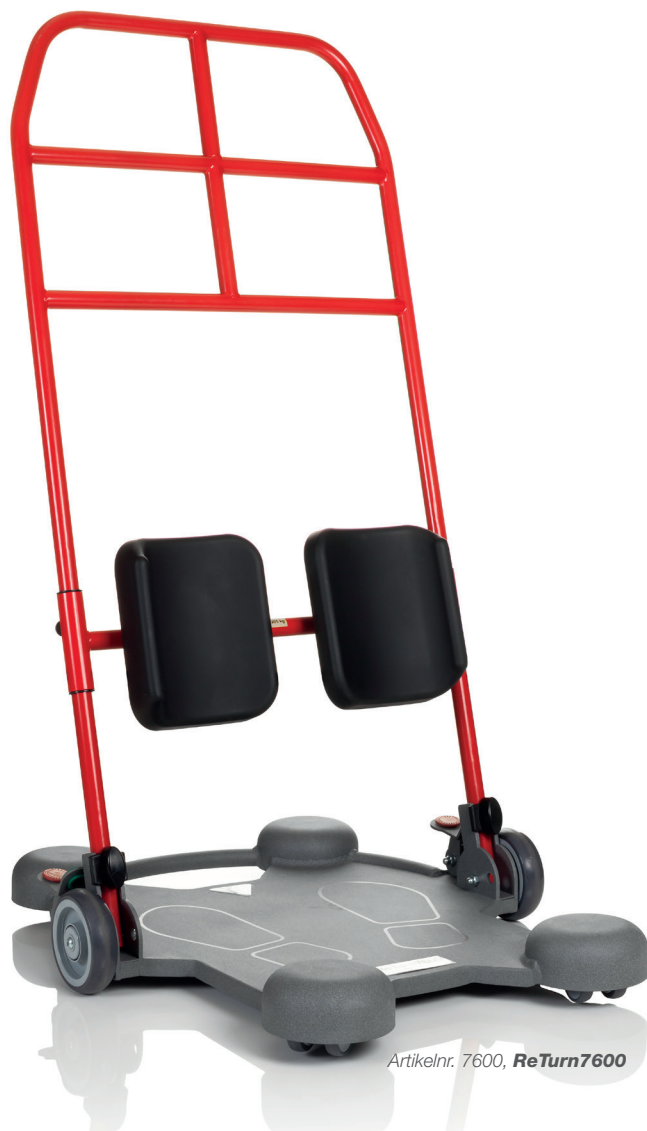
Artikelnr. 7600, ReTurn7600