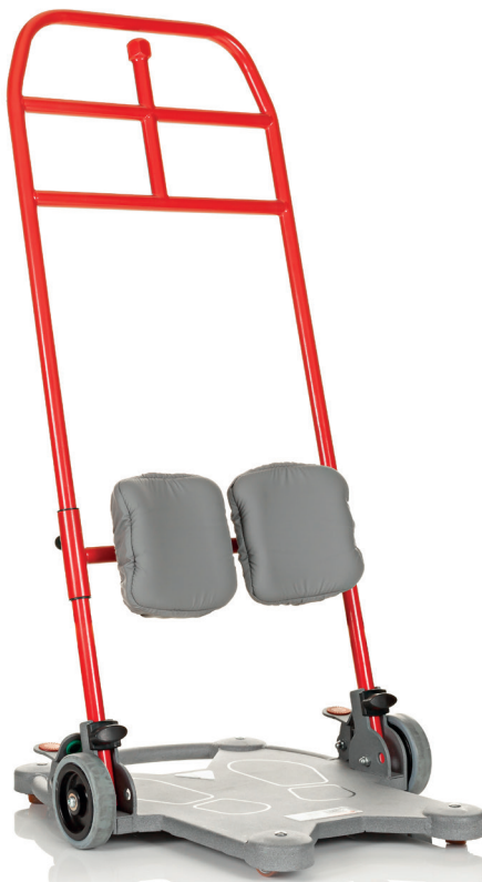
ReTurn7500 is geschikt voor de meeste volwassenen.

De ReTurn7500 is dus het origineel en een succesverhaal dat alle tekenen van een klassieker heeft. Om oplossingen te kunnen bieden voor nog meer situaties en om tegemoet te komen aan de behoeften van meer types zorgvragers, hebben we nog meer modellen van ReTurn ontwikkeld. We hebben de ReTurn7500 ook verder verfijnd. Het basisprincipe achter ReTurn blijft echter hetzelfde: de eigen kracht en mogelijkheden van de zorgvrager moeten gebruikt en verbeterd worden. Alle modellen van ReTurn delen daarom een aantal belangrijke functies: ze helpen de gebruiker te activeren en ze ondersteunen de natuurlijke bewegingen van de zorgvrager. Ze geven zorgvragers ook de mogelijkheid om zichzelf regelmatig op te heffen tot een staande positie. Kwaliteit van leven is soms zo iets eenvoudigs als in staat zijn om je eigen kracht en mogelijkheden te gebruiken.