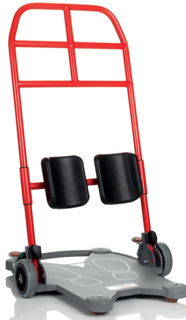
ReTurn7400 is ideaal voor kleine volwassenen en kinderen.