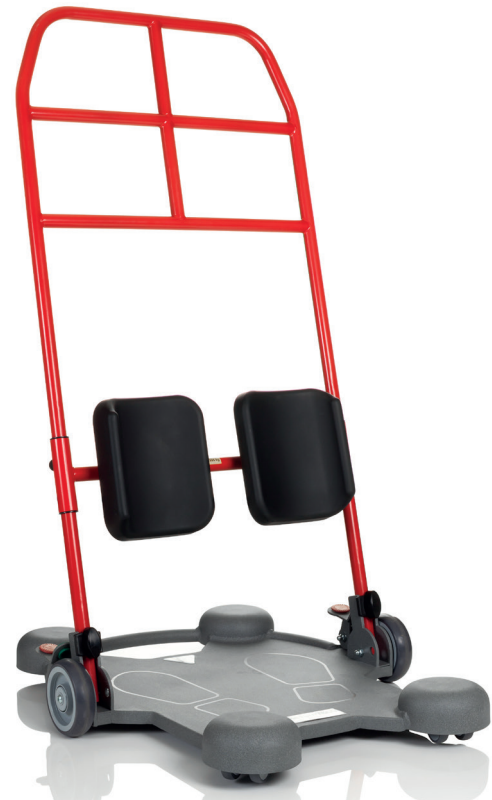
ReTurn7600 is ontwikkeld voor grotere en zwaardere zorgvragers met een gewicht tot 205 kg.