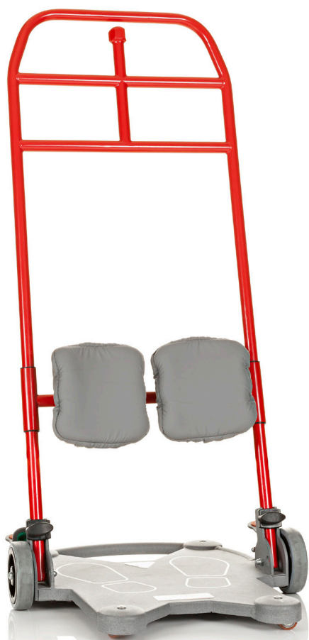
Art.nr. 7500i, ReTurn7500 , ekstra polstring for støttene for nedre del av bena er inkludert som standard