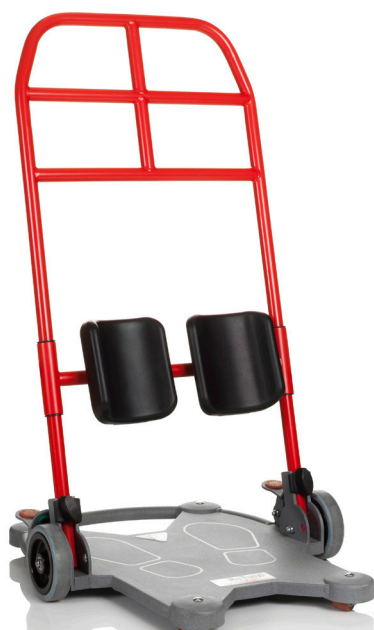
ReTurn7400 er ideell for barn samt voksne som ikke er så høye.