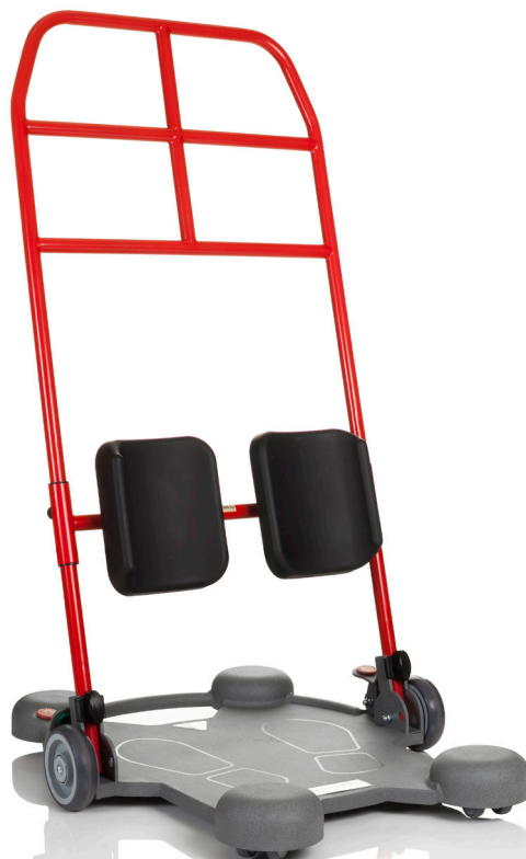
ReTurn7600 er udviklet til større og tungere brugere, som vejer op til 205 kg.