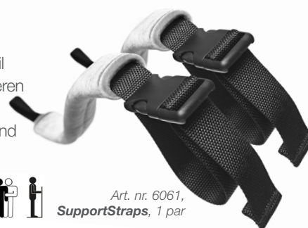
Art. nr. 6061, SupportStraps, 1 par

SupportStraps er et tilbehør, som sammen med ReTurnBelt fungerer som sidestøtte til ReTurn7500/7400/7600. En SupportStrap fastgøres på hver side af stigen. Når brugeren er kommet op i stående, knappes den anden ende af SupportStrap fast i et egnet håndtag på hver side af ReTurnBelt. SupportStraps kan også anvendes som skridtbånd til EasyBelt og FlexiBelt i forbindelse med stå- og gangtræning.