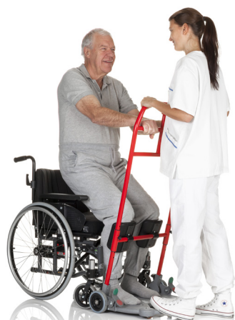
En medhjælper skal have en fod på bundpladen under hele proceduren for at yde modvægt.

ReTurn er en enkel og sikker måde at rejse sig aktivt på. Stigerne på ReTurn7500/7400/7600 er viklet fremad i retning væk fra brugeren. Denne konstruktion giver brugeren masser af plads og mulighed for at komme tilstrækkeligt tæt på til at rejse sig til stående stilling ved at bruge sin egen kraft og et naturligt bevægelsesmønster.