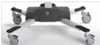
TR 2000 Hydraulisk - med förhöjningssats TR 3000 Batteridrivna - med förhöjningssats