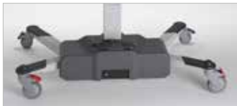
TR 3000 Batteridrivna - Baksida av chassi