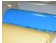
Färg alternativ på madrass och kuddar