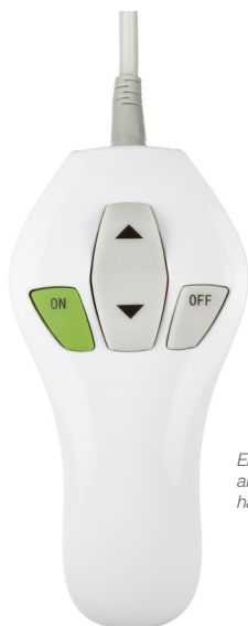
Ergonomisk och användarvänlig handkontroll

För professionella och mycket funktionella vårdmiljöer med en harmonisk och mänsklig atmosfär.