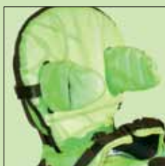
120-777* Utforingspute rygg 1" inkludert sidestøtter