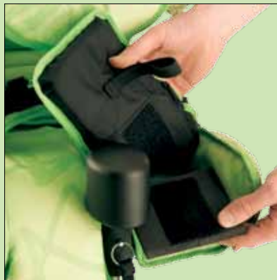
2. Støtte under lårene