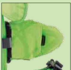
120-762* Sidestøtter faste 120-837* Sidestøtter utsvingbare