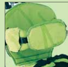
137-807* Trekk sidestøtter hodestøtte