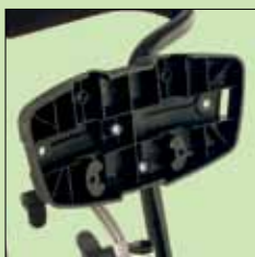
117-697 Hodestøtte uten pute

Tilbehør merket med * skal etterfølges av fargekode ved bestilling, -01 grønt, -02 oransje, -03 blå eller -04 rosa.