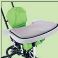
120-270 Polster bord