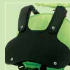
120-799 Vest str small 120-757 Vest str medium