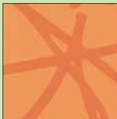
120-710-02 Setetrekk oransje