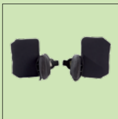
120-954 Sidestøtter med armstøtte uten trekk