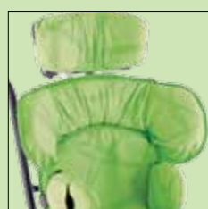
120-702 Skulderstøtte 120-828* Pute til skulderstøtte