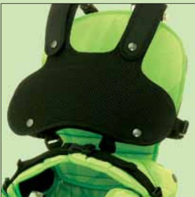
8. Vest - tilbehør