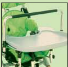
117-769 Støtte- og aktivitetsstang