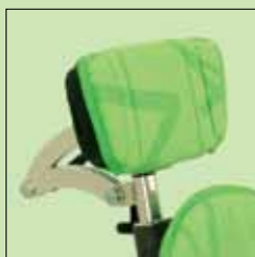
117-850* Hodestøttepute flat, inkluderer ikke hodestøtten