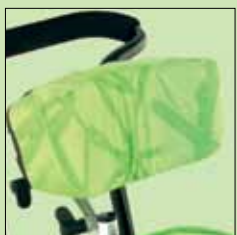
137-698* Hodestøttepute formet, inkluderer ikke hodestøtten