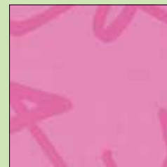
120-710-04 Setetrekk rosa

Setetrekk inneholder: Ryggpute, setepute, bekkenstøttepute og trekk til lår støtter.