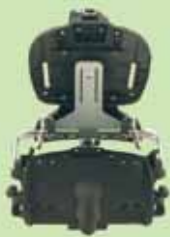
120-610 Sittemodul Squiggles seteskall