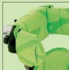
118-667 Sidestøtter til hodestøtte uten putetrekk