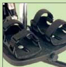
117-1781 Fotsandaler str small 117-2781 Fotsandaler str medium