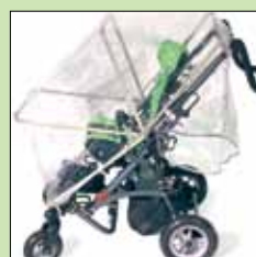
RC01 Regntrekk (kun til bruk med vognunderstell)