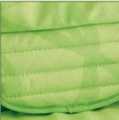
1. Fleksibel bekkenstøtte