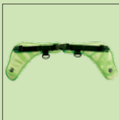
120-844* Bekkenbelte str small