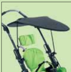
117-832 Solskjerm (kun til bruk med vognunderstell)