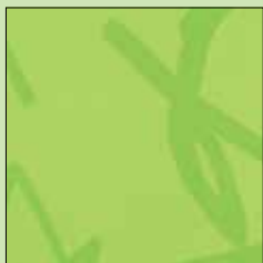
120-710-01 Setetrekk grønn