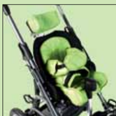
120-945 Svop (til bruk på vognunderstell for avskjerming)